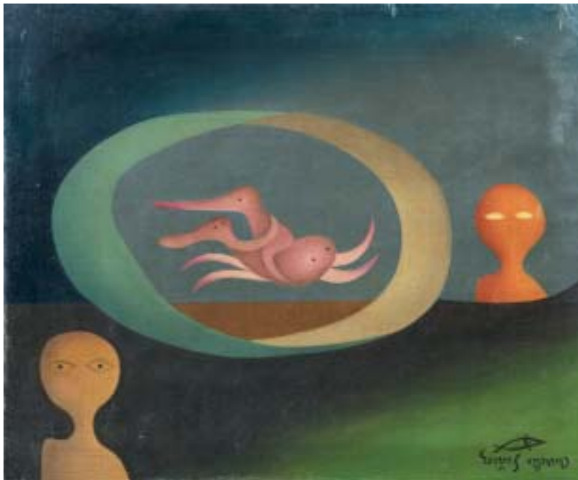
GALOPE DEL TIEMPO, 1948. Óleo sobre lienzo; 38 x 46 cm [Cat. núm. 13]