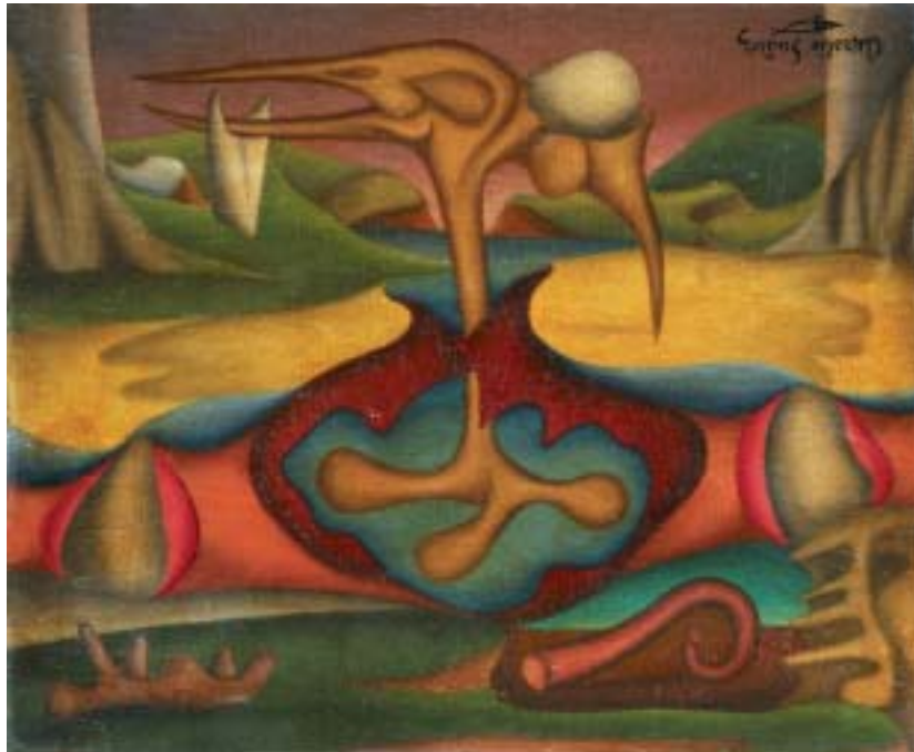
TODO FUE, 1939. Óleo sobre lienzo; 38 x 46 cm [Cat. núm. 2]