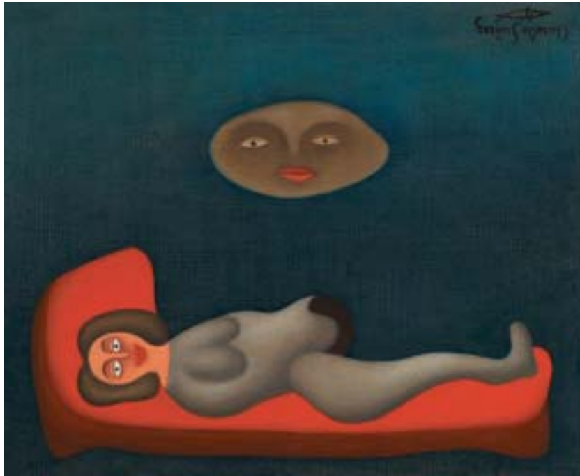
LUNAFILIA, 1954. Óleo sobre lienzo; 38 x 46 cm [Cat. núm. 20]