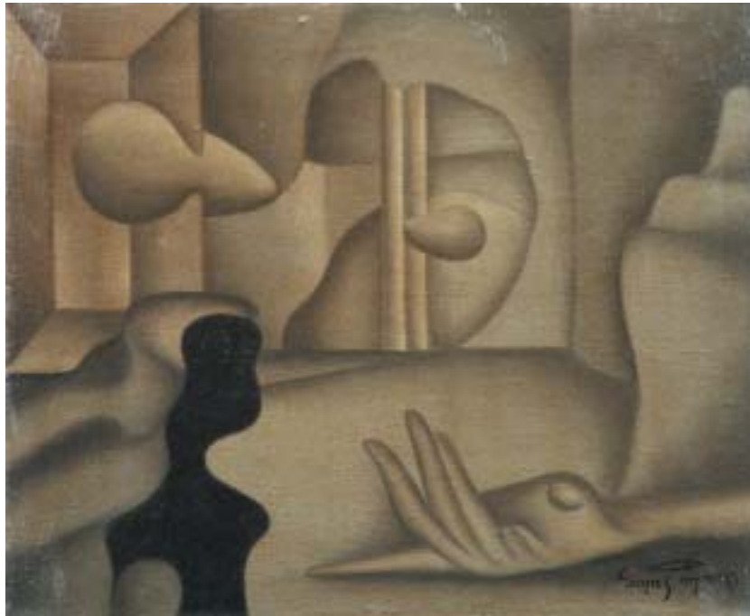
ESPECTRO DEL PASADO, 1943. Óleo sobre lienzo; 38 x 46 cm [Cat. núm. 7]