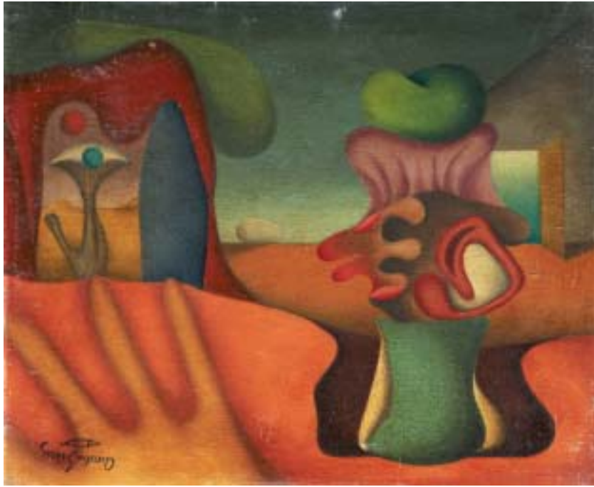
VIDA MUERTA, 1939. Óleo sobre lienzo; 38 x 46 cm [Cat. núm. 1]