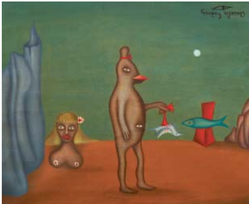
JUAN CARNECRUDA, 1953. Óleo sobre lienzo; 38 x 46 cm [Cat. núm. 19]