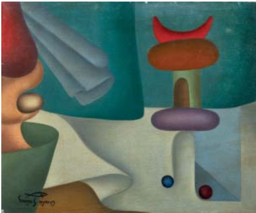
FIGURAS CONCRETAS, 1946. Óleo sobre lienzo; 38 x 46 cm [Cat. núm. 10]