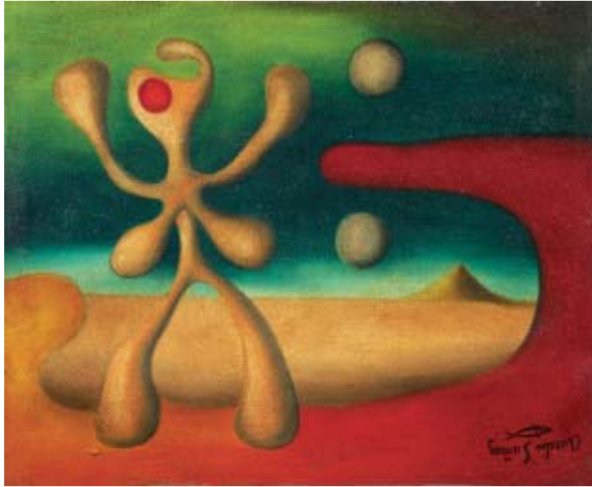
NOCHE CON DOS LUNAS, 1943. Óleo sobre lienzo; 38 x 46 cm [Cat. núm. 6]