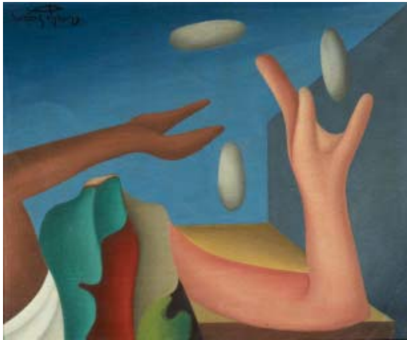
MALABARISTA, 1947. Óleo sobre lienzo; 38 x 46 cm [Cat. núm. 11]