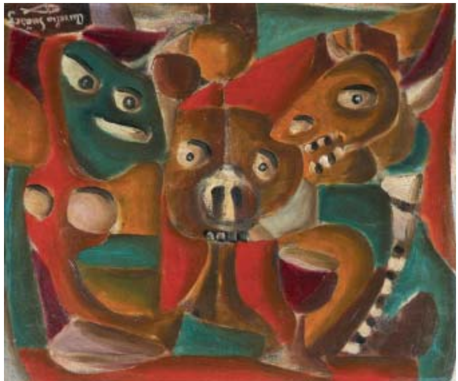
TERCETO, 1949. Óleo sobre lienzo; 38 x 46 cm [Cat. núm. 16]