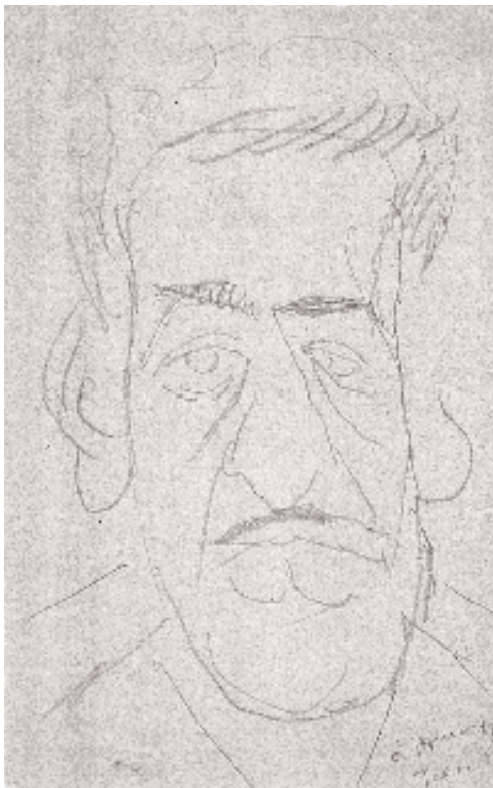
Retrato de Óscar Domínguez por el artista Pierre Tal-Coat, h. 1950.

El archipiélago canario, más próximo al continente africano que a la metrópoli, avanzadilla hacia los países suramericanos con los que comparte aspectos geográficos, raciales y de costumbres, tal las existentes de los carnavales del Río de Janeiro y con los de Tenerife, al tiempo de ser culturalmente español y geográficamente africano, posee una vocación cultural europea.