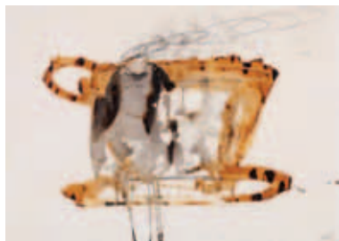
Papel No. 11 , 1969. Técnica mixta sobre papel. 51 x 72.5 cm

convicción yo diría que su gran maestro, entre otras cosas porque los intereses de los otros se dispersaron en territorios expresivos que no afectaban a las cuestiones esenciales de una reflexión material de tanta profundidad filosófica y poética como la suya.