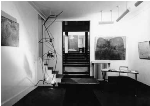
Exposición Tàpies en la Galerie Stadler (París, 1956) donde aparece esta obra a la derecha