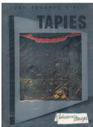
J.E. Cirlot, Tàpies , Ed. Omega, 1960

Luego de esta década las cosas fueron distintas. Se incorporaron paulatinamente más objetos y de manera menos justificada, aparecieron recuerdos de otros movimientos, el espíritu se hizo menos esencial y la morfología fue perdiendo contención y gravedad, surgieron las reiteraciones, a pesar de una indudable fecundidad, los verdaderos aciertos se distanciaron, se hizo presente una iconografía imprevisible y más obvia... Pero para entonces ya habían aparecido cientos de obras maestras que figuran para siempre en un lugar muy alto de la historia del arte +