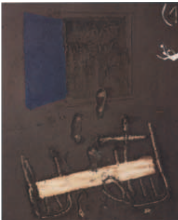
Dietari núm. 1, 2002

Observo a la derecha, en el quinto y último panel pictórico donde leo como rúbrica: “a-univers, b-cos glorios, c-respiració conscient. ARA I AQUI. Juliol 2002”, escrita junto a una cruz blanca sobre negro-negro, en su norte un “JO” y en el sur un “TU”. Dos cazos con arroz se presentan, como ofrendas, sobre un luminoso polvo de mármol esgrafiado con las primeras letras del alfabeto.