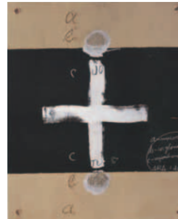
Dietari núm. 5, 2002

Entre paréntesis, pienso en el protagonista de aquel relato de Albert Camus, en su libro El exilio y el reino donde un pintor, al final del trayecto, realiza una tela enteramente blanca, en el centro de la cual se había limitado a escribir en caracteres muy pequeños, una palabra que se podía descifrar pero que no se sabía bien si decía, solitario o solidario .