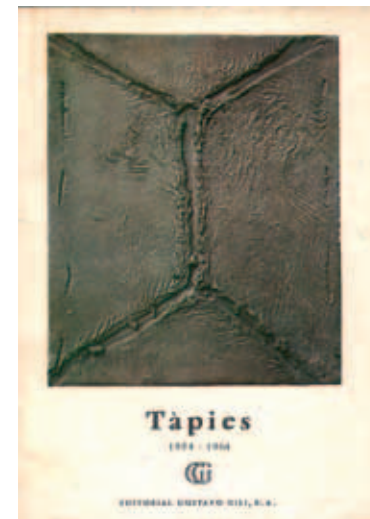
Tàpies. 1954-1964. Ed. Gustavo Gili, 1964

No veo fácil que pueda ser calificado de suntuoso un arte que se basa en manchas imprecisas, materias terrosas, polvos de mármol, tablonas, trapos y toda clase de objetos de desecho, y sin embargo creo que el poema matérico de Tàpies es de una suntuosidad que va más allá del adorno, del lujo y del poder. Es la suntuosidad del conocimiento, de la sabiduría, de la revelación. No se encuentra en toda la pintura de materia una manera tan plena y veraz de extenderla, de hollarla o agredirla, de teñirla o de pintarla, o de signarla, pues en todas estas acciones se mostró Tàpies dueño de una percepción y de un equilibrio enormes. Ya sé que hay una peligrosa mística que