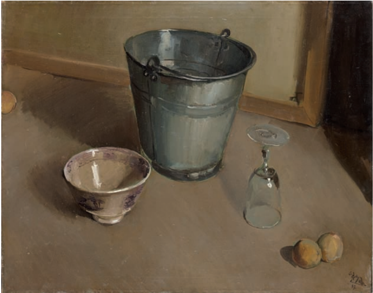
HOMENAJE A SANTA TERESA , 1947. Óleo sobre lienzo. 60 x 75 cm [cat. núm. 7]