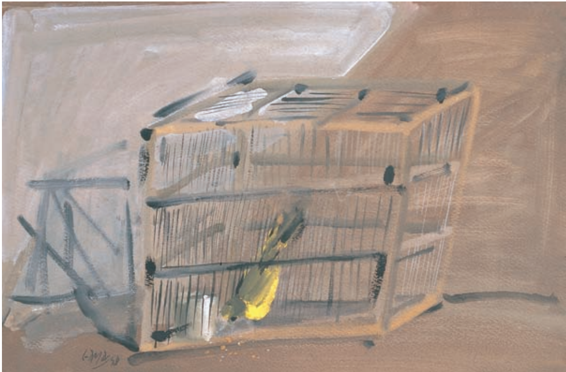
PÁJARO EN JAULA , 1948. Gouache sobre cartulina. 30.5 x 45.5 cm [cat. núm. 11]