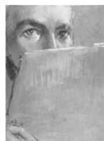
Reproducido en p. 13