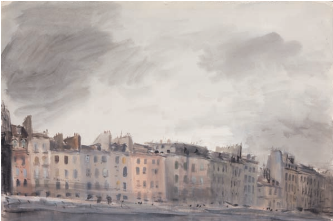
LA ORILLA IZQUIERDA DEL SENA- PARÍS , c. 1953. Acuarela sobre papel. 44 x 65 cm [cat. núm. 21]