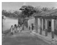
Reproducido en p. 15