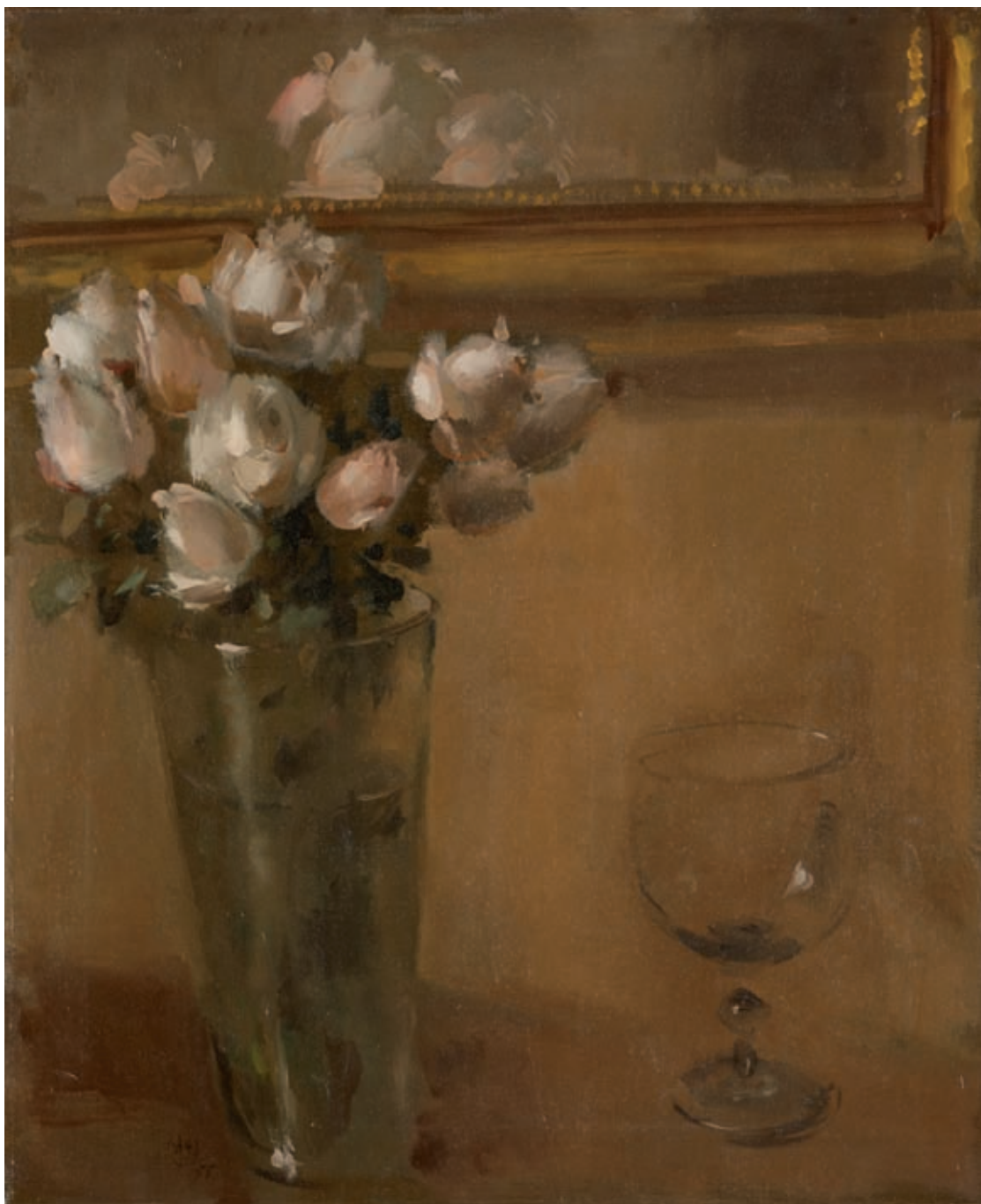
FLORERO CON COPA , 1955. Óleo sobre lienzo. 55 x 45.5 cm [cat. núm. 29]