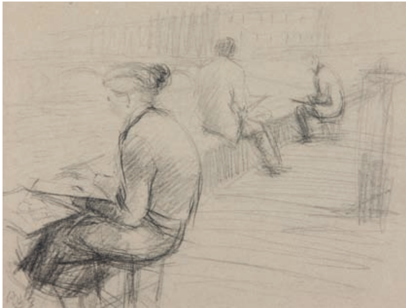
DIBUJANDO EN LA ORILLA DEL SENA , 1953. Lápiz sobre papel. 20 x 26.5 cm [cat. núm. 20]