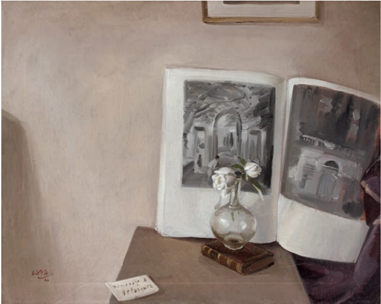
VILLA MEDICI (HOMENAJE A VELÁZQUEZ) , 1946. Óleo sobre lienzo. 61 x 76 cm [cat. núm. 5]