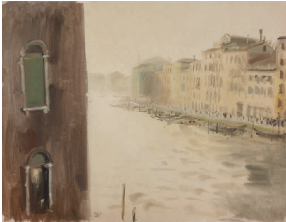
EL GRAN CANAL , 1953. Acuarela sobre papel. 50 x 65 cm [cat. núm.26]