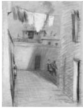
Reproducido en p. 27