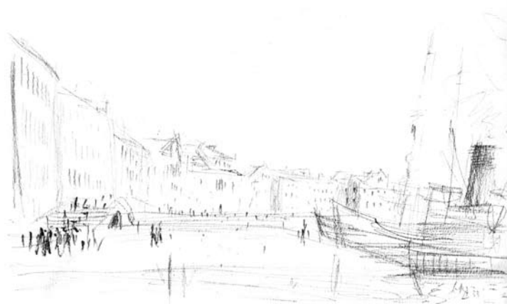
Album [Cat. núm. 35]