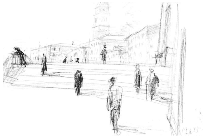
Album [Cat. núm. 35]