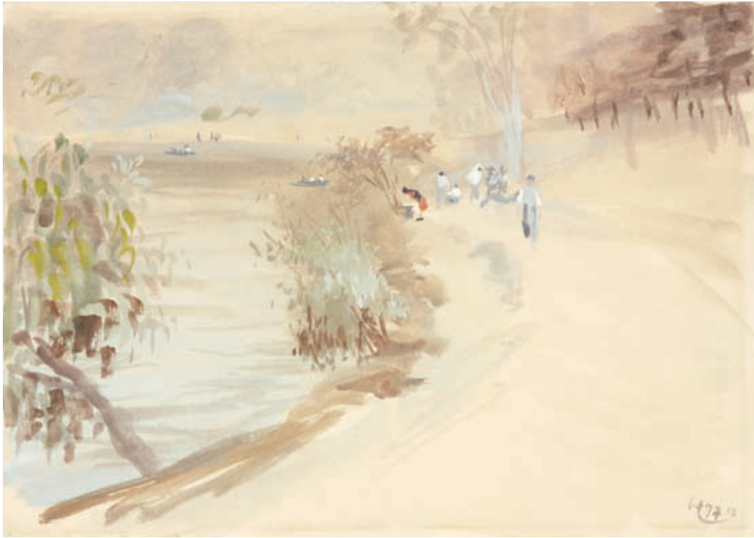
CHAPULTEPEC , 1942. Acuarela y gouache sobre papel. 25 x 35 cm [cat. núm. 2]