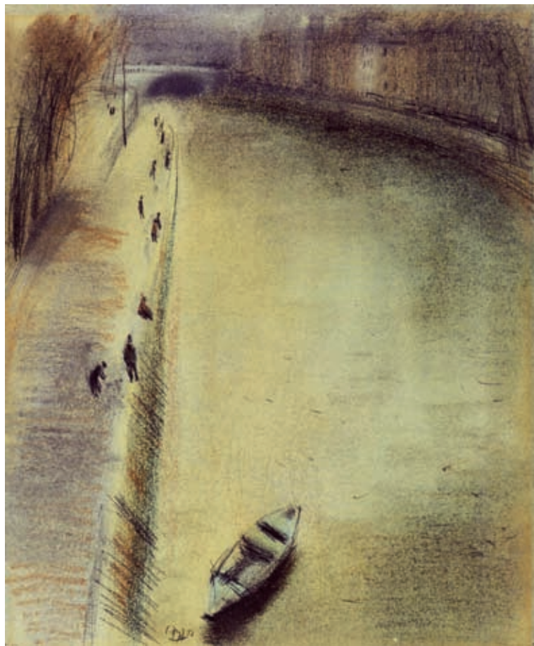
LA BARCA (EN EL SENA) , 1952. Pastel sobre papel. 30 x 24 cm [cat. núm. 19]