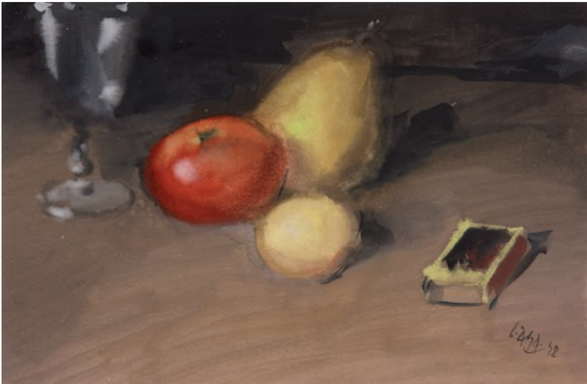
BODEGÓN CON FRUTAS, COPA Y CERILLAS , 1948. Pastel sobre cartulina. 32 x 46 cm [cat. núm. 12]