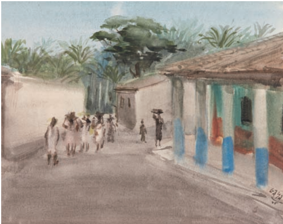
CALLE DE ACAPULCO , 1945. Acuarela sobre papel. 22.5 x 23.5 cm [cat. núm. 3]