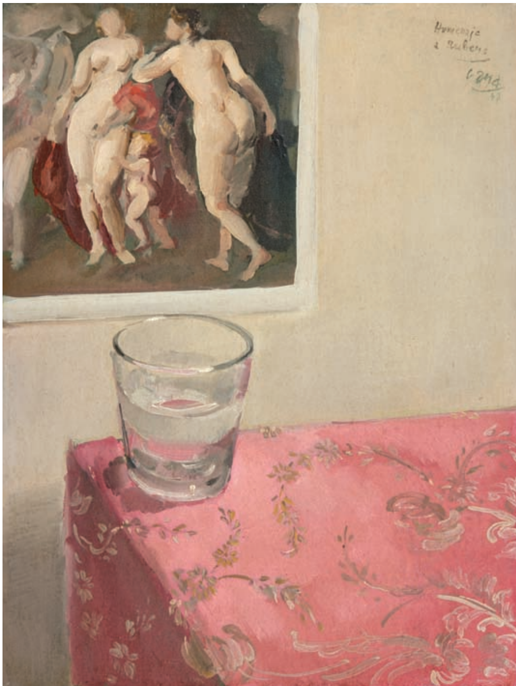
HOMENAJE A RUBENS , 1947. Óleo sobre tabla. 40 x 30 cm [cat. núm. 8]