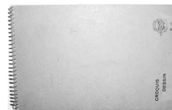
Reproducido en pp. 29, 35 y cubierta

Cuaderno de 22 hojas con 20 dibujos a lápiz y carboncillo, algunos de ellos firmados y fechados. Realizado durante su viaje de París a Venecia en 1953. Inscrito a tinta de su mano "Venezia" en la cubierta. 13.5 x 22 cm