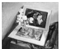
Reproducido en p. 16