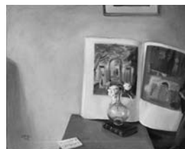
Reproducido en p. 17