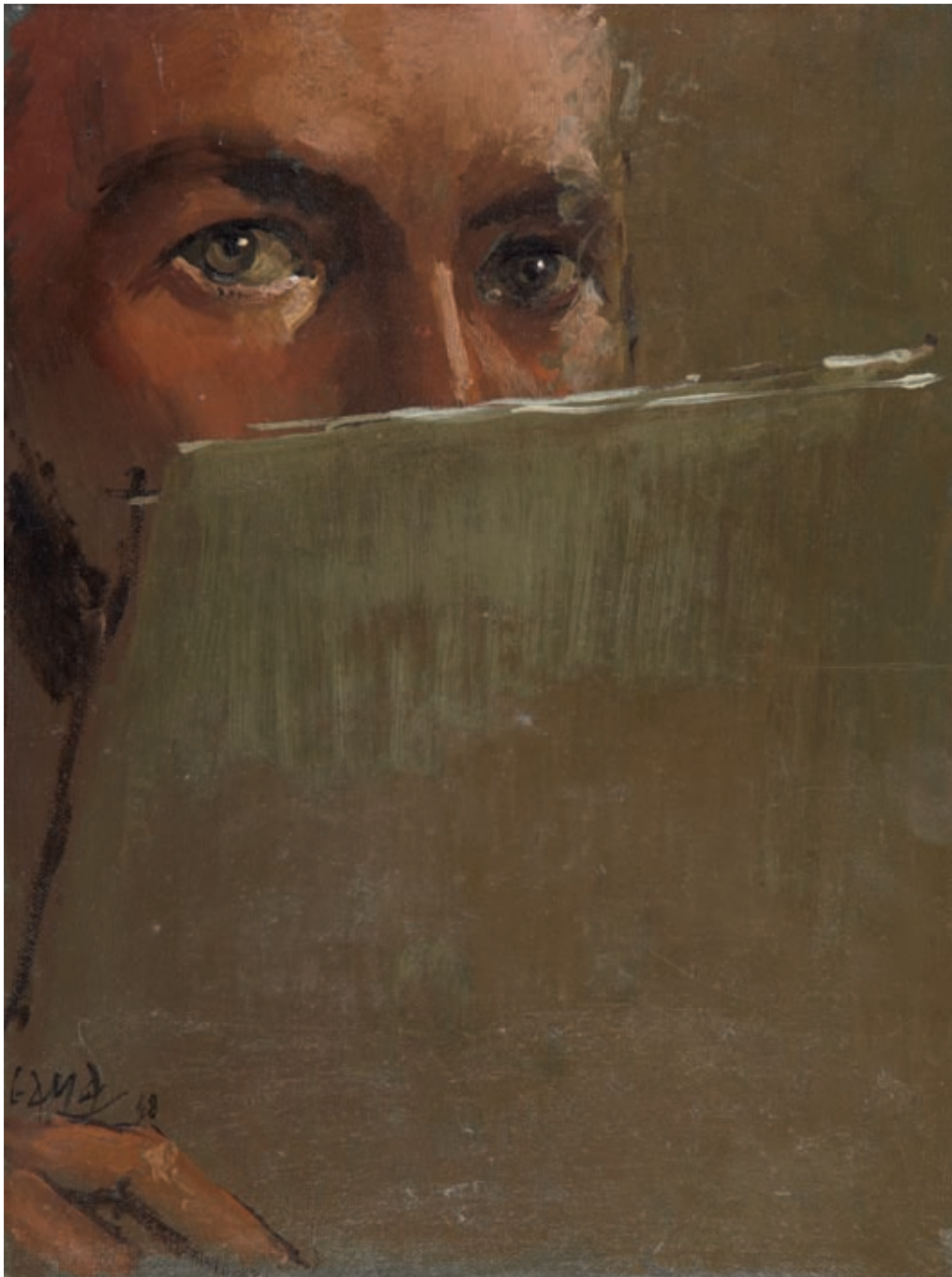
AUTORRETRATO , 1948. Óleo sobre lienzo. 30.5 x 23 cm [cat. núm. 13]