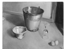
Reproducido en p. 19