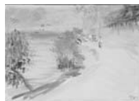
Reproducido en p. 15