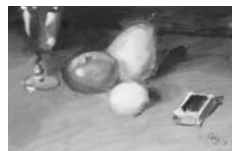
Reproducido en p. 21

Las Palmas de Gran Canaria, Irradiaciones de Oramas , noviembre – diciembre de 2008; cat. p. 77 (reproducido en color)