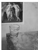
Reproducido en p. 20