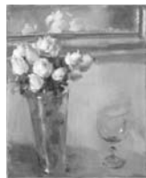
Reproducido en p. 28

Óleo sobre lienzo Firmado y fechado 55 55 x 45.5 cm Procedencia: Colección particular, Barcelona Columna Art i Edicions, Barcelona Exposiciones: Barcelona, Columna. Art i edicions, Naixement de la pintura , 1997, cat. p. 5, reproducido en color