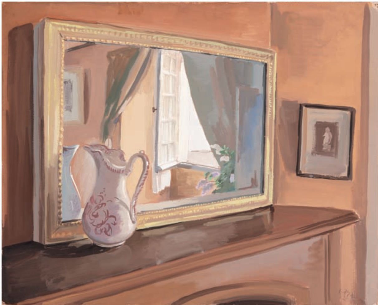
INTERIOR (CARDESSE) , 1939. Gouache sobre papel. 40.5 x 50 cm [cat. núm. 1]