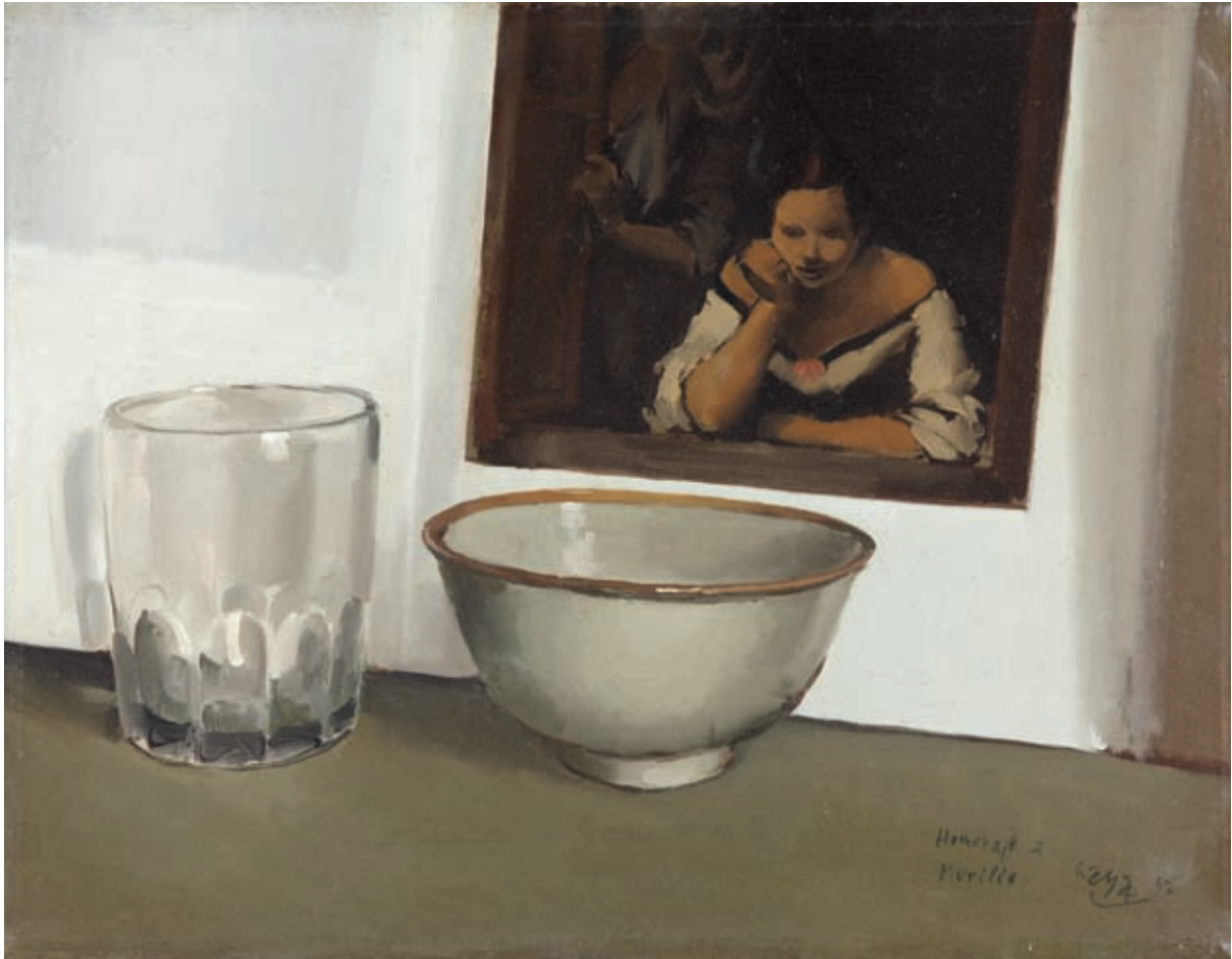
HOMENAJE A MURILLO , 1947. Óleo sobre lienzo. 35 x 45 cm [cat. núm. 6]