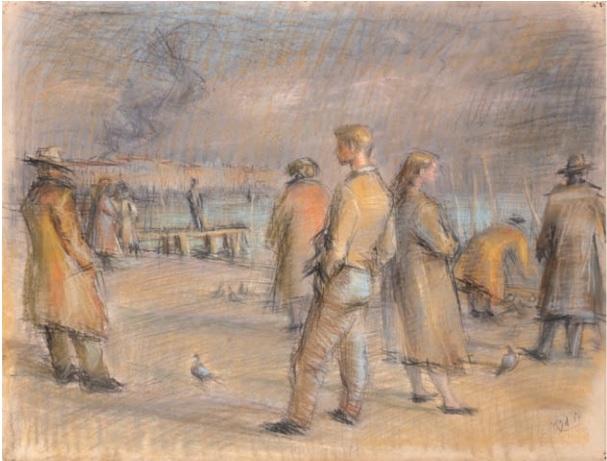
RIVA DEGLI SCHIAVONI , 1954. Lápiz, carboncillo y pastel sobre papel. 48 x 63.5 cm [cat. núm. 27]