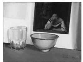
Reproducido en p. 18