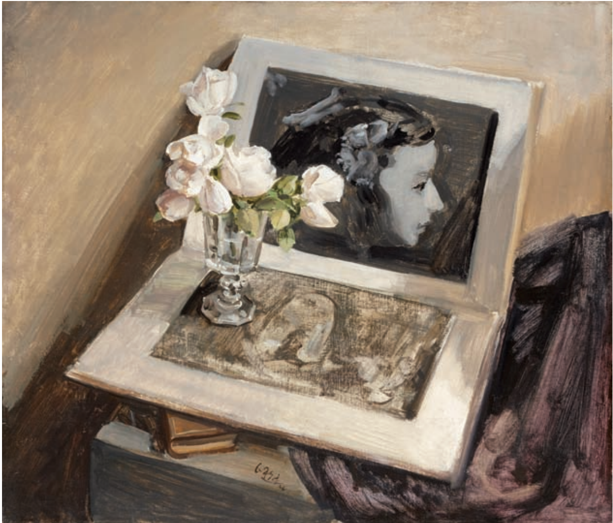
HOMENAJE A VELÁZQUEZ , 1946. Óleo sobre lienzo. 60 x 70 cm [cat. núm. 4]