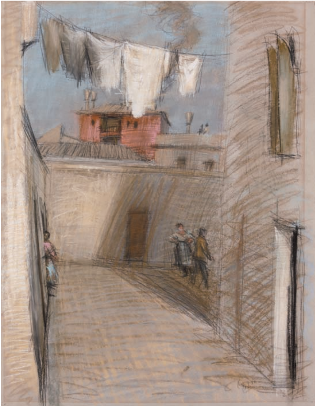
AZOTEA DE VENECIA , 1955. Lápiz y pastel sobre papel. 64 x 50 cm [cat. núm. 28]