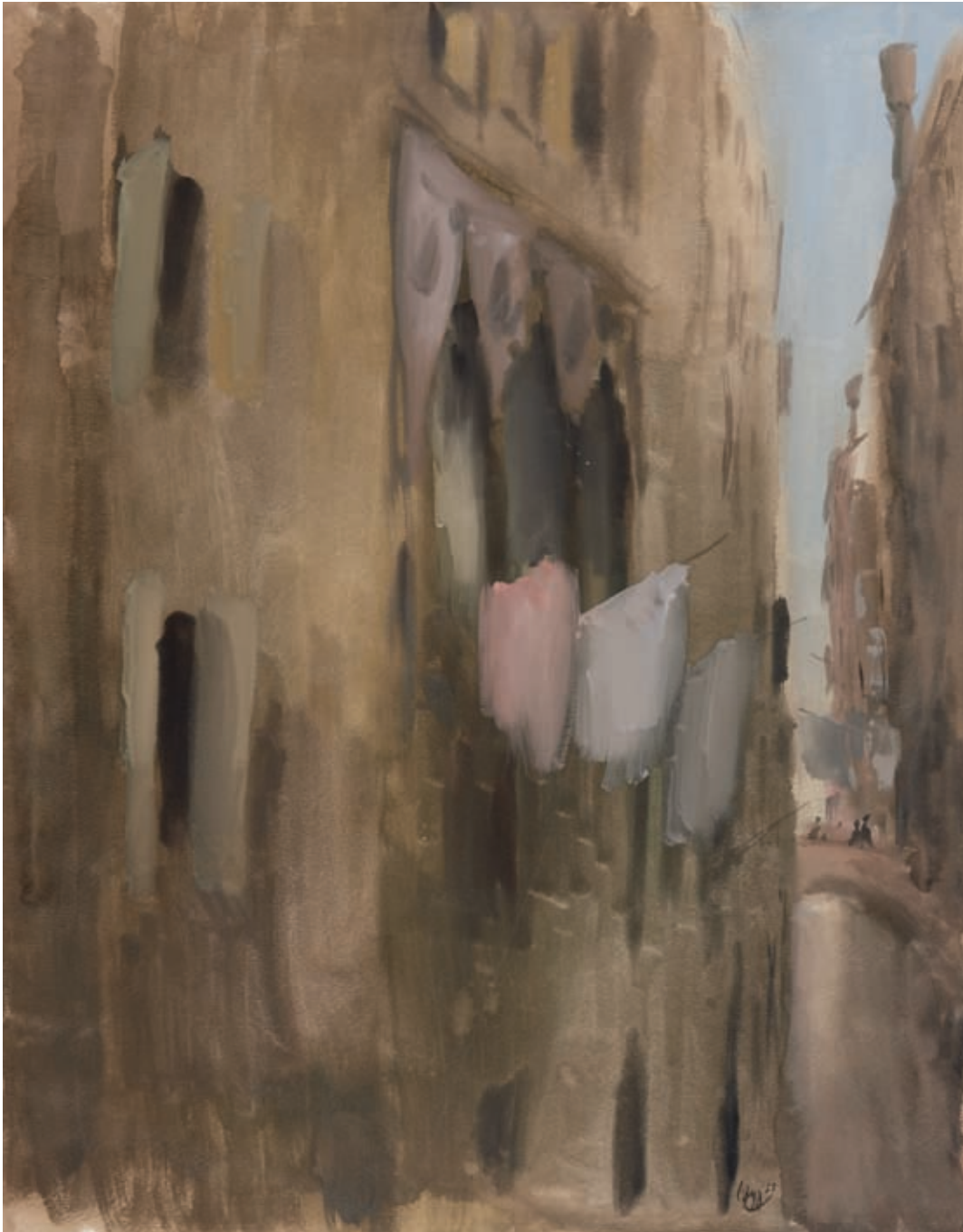
LA ROPA TENDIDA , 1953. Acuarela sobre papel. 51 x 40 cm [cat. núm. 25]