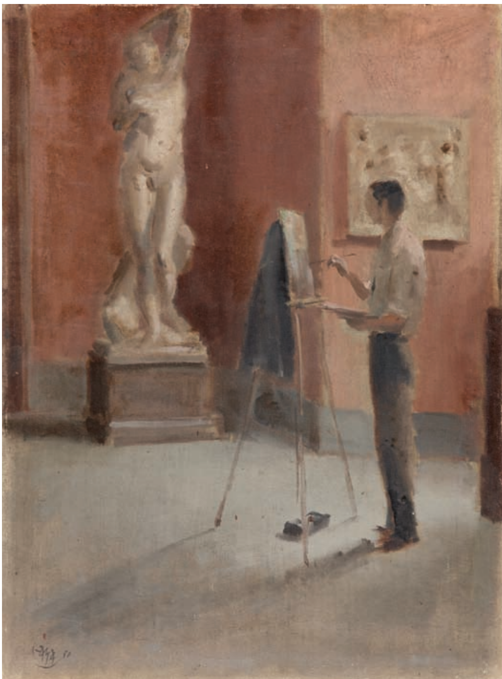
EN EL MUSEO , 1950. Óleo sobre masonite. 60.5 x 45.5 cm [cat. núm. 16]