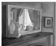
Reproducido en p. 14